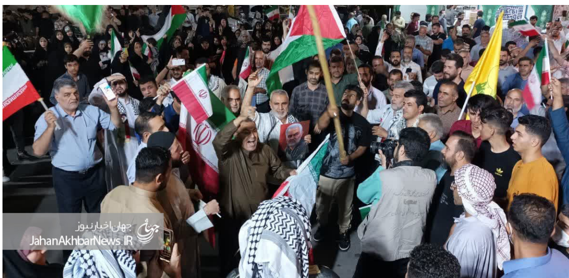
جهان‌اخبار نیوز JahanAkbarNews.IR