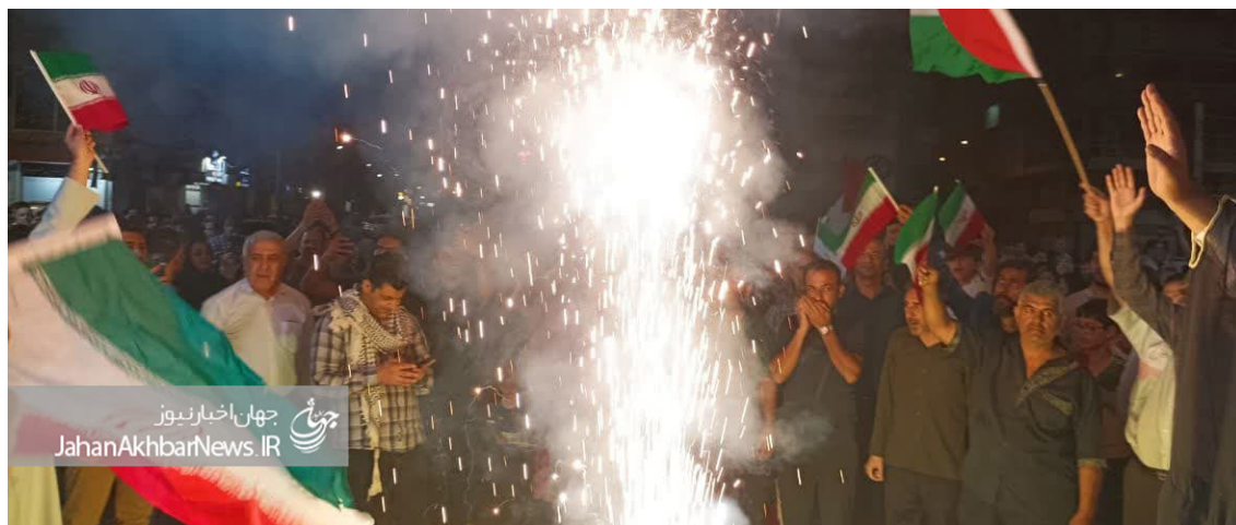
جهان‌اخبار نیوز JahanAkbarNews.IR