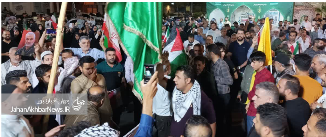
جهان‌اخبار نیوز JahanAkbarNews.IR

به گزارش مهدی محمد زاده خبرنگار مجموعه خبری جهان اخبار: جشن مردم ولایتمدار و شهید پرور اهواز در حمایت از حمله موشکی سپاه پاسداران جمهوری اسلامی و جبهه مقاومت پس از حمله موشکی و پهپادی بصورت خودجوش برگزار شد