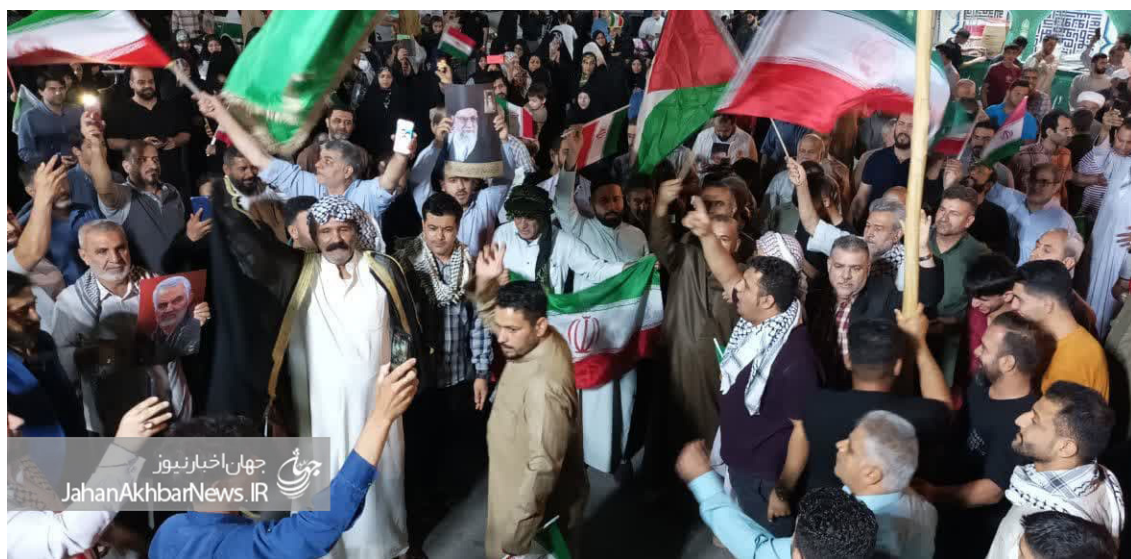
جهان‌اخبار نیوز JahanAkbarNews.IR